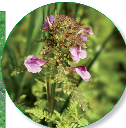
Kärrspira har kommit fram tack vare arbetet på Dyviks lövängar.