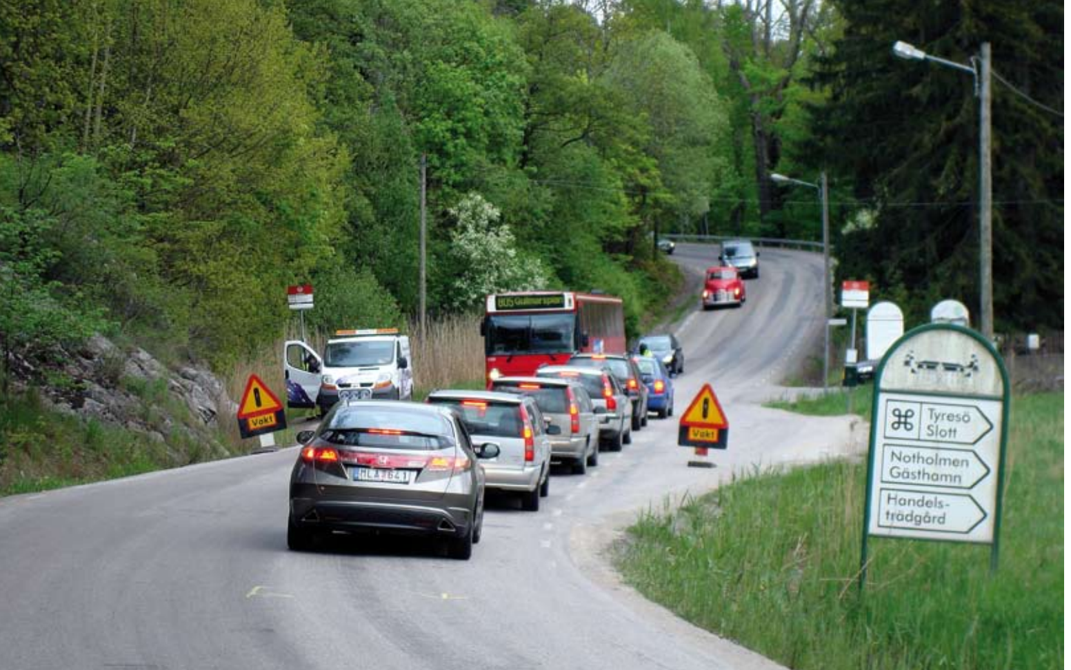
Med början under 2011 kommer framkomligheten på Breviksvägen att tidvis begränsas.