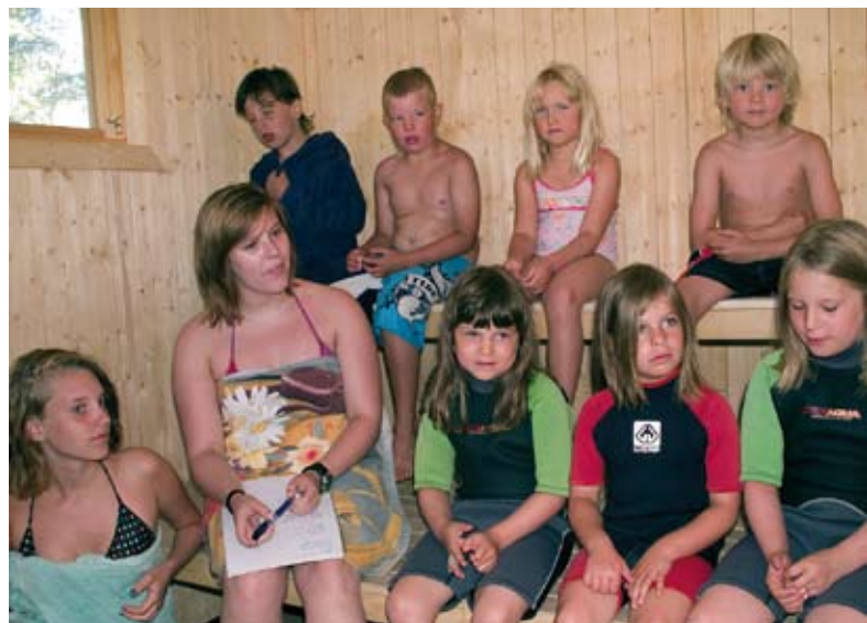
Varm och skön gemenskap i Breviksbadets värmestuga!

EN FOTBOLLSPLAN HAR BYGGTS intill Brevik skola och vi hoppas nu på att få anlägga en badplats i Kalvfjärden alldeles nedanför skolan.