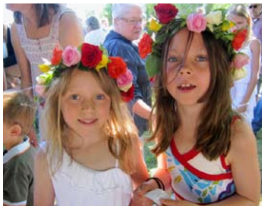
Vill vi ha kvar midsommarfesten på Ällmoraängen, så kanske några vill arrangera det nästa sommar...

Tider, se www.tyresonas.se eller på Villapostens sista sida.