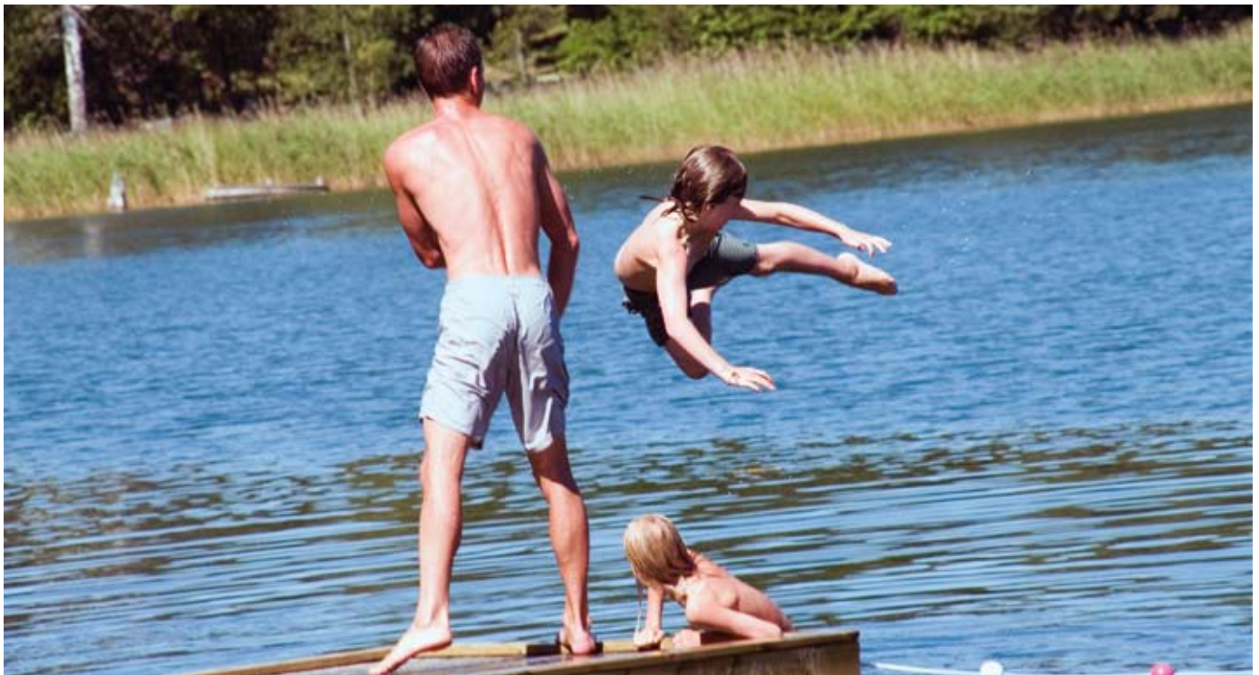
Lek och staj för de äldre barnen på simskolan vid Breviksbadet.

Dyviks lövängar - kontakta Harald Berg, 08-770 70 61