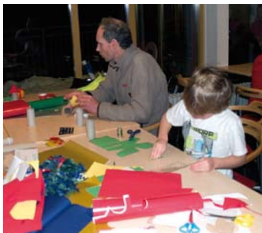
Aktiviteter för barn och ungdomar med föräldrar.