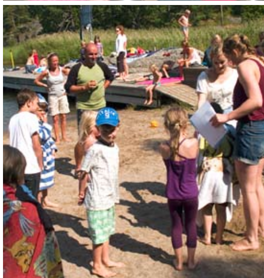
Ta med picknickkorgen till avslutningen!