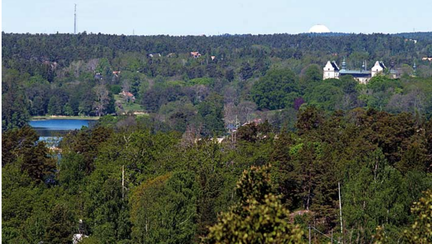
Från Tyresö Slott till Globen på 25 minuter.

Styrelsen lyssnar på medlemmarnas viktiga ärenden och arbetar ständigt med förbättringar på Brevikshalvön. Vi för en bra dialog med ansvariga politiker och tjänstemän i Tyresö kommun, där vi framför våra angelägna ärenden och söker praktisk och ekonomisk hjälp till det vi anser viktigt.