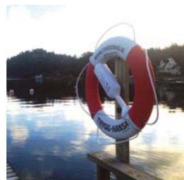
Föreningen har köpt in nya livbojar till baden.