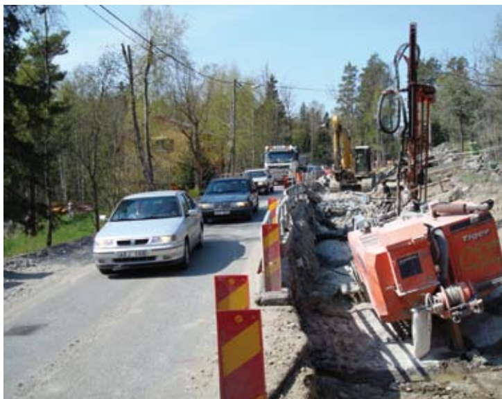
Breviksvägen - Nytorpsvägen.

I höst börjar omvandlingen av Ugglevägen etapp 9 för att göra det möjligt för permanentboende. Gator ska breddas och få belysning och vatten- och avloppsledningar ska dras. Utbyggnaden av Brobänken etapp 10 startar tidigast nästa sommar.