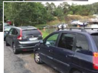
En sommardag vid Breviksmaren