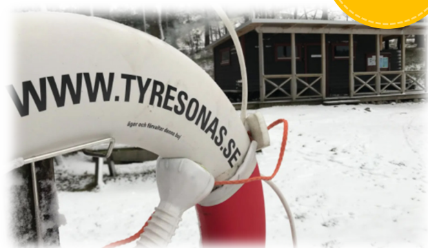
Villaägareföreningens bastu vid Breviksmaren är ett initiativ av föreningsmedlemmar, likaså simskolan.

” - Ju fler föreningsmedlemmar vi är på halvön desto mer roligare och roligare blir det att ro.